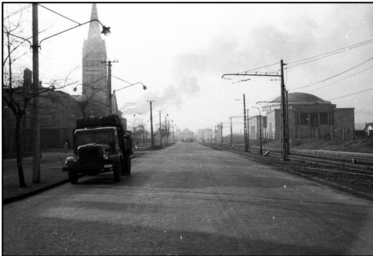
4. kép A Népstadion metróállomás 1960-ban. Tervező: Nyiri István