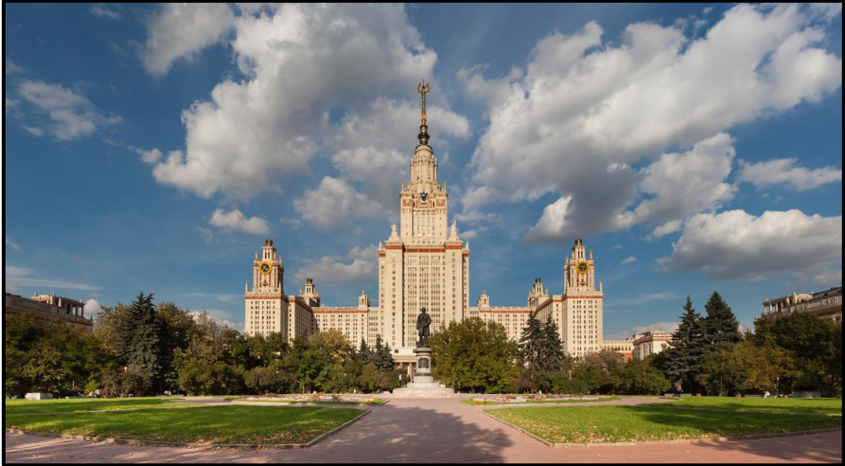
3. kép A Moszkvai Állami Egyetem épülete Moszkvában, napjainkban