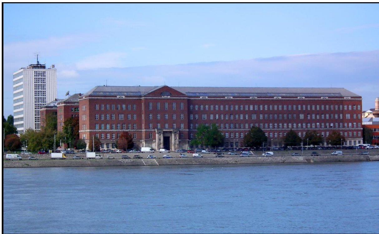
5. kép A Budapesti Műszaki-és Gazdaságtudományi Egyetem „R” épülete napjainkban

éppen nyilvánvaló eleganciája volt az a vonás, ami az előadó véleménye szerint a művet a modernista épületek átlaga fölé, így a megtűrhető kategóriába emelte. 63 Igaz, az építész az antik elemek stilizált felhasználásával – sajnálatos módon – eklekticizáló modort alakított ki, amely vonások pedig „nem magyar jellegűek és ezért a tömegek számára érthetetlenek is”. 64 (5. kép)