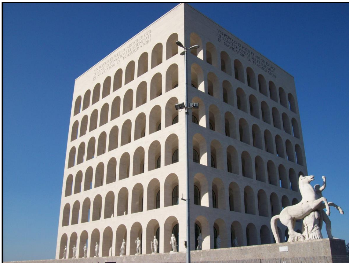
1. kép Az Olasz Civilizáció Palotája Rómában, napjainkban.

szintén Brasini által tervezett Szovjetek Palotájának 426 méteres magasságát is meghaladta volna. 5