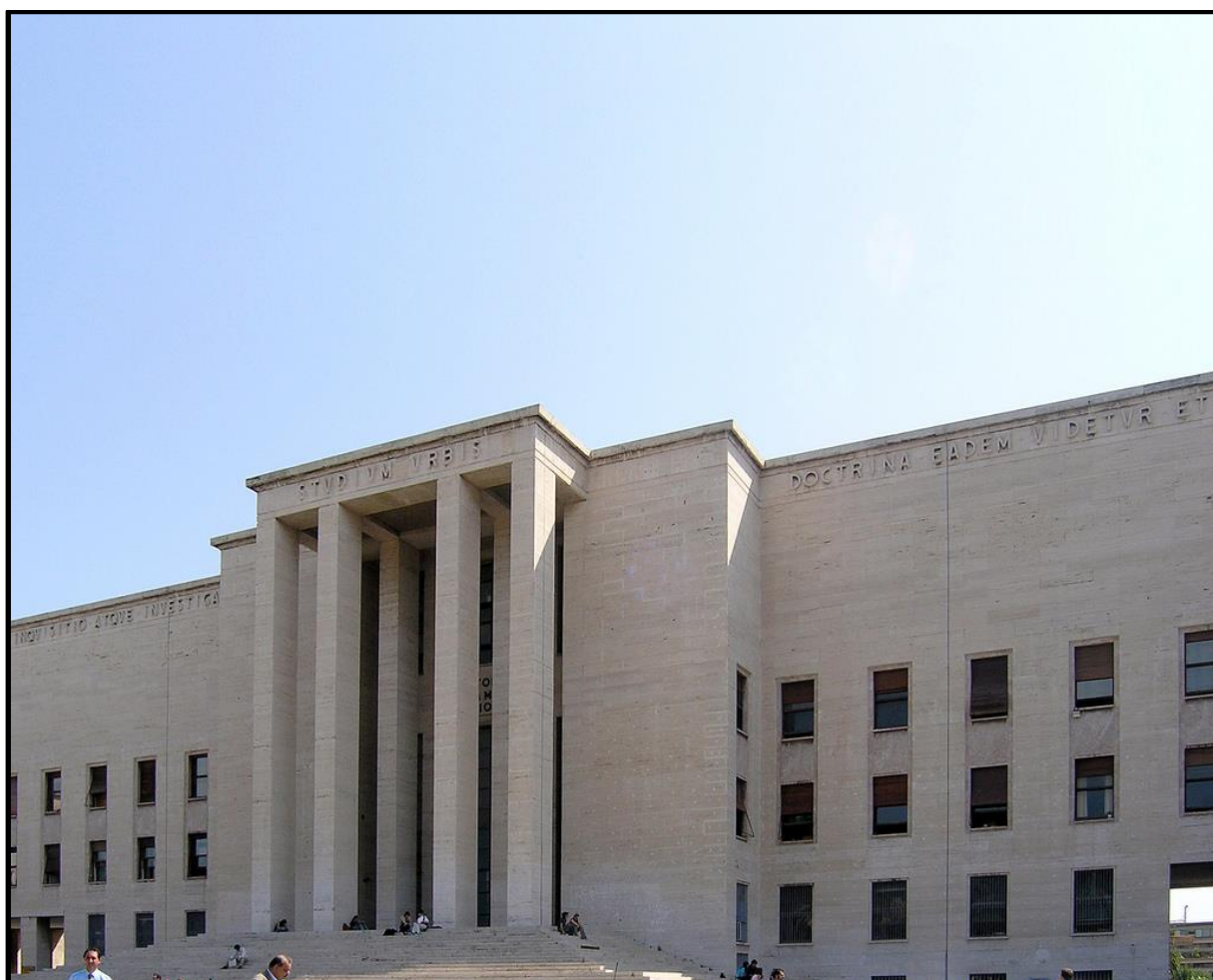
2. kép A Sapienza Egyetem épülete Rómában, napjainkban

ideológiájához hű szellemi elit képzéséhez. Sztálinnal ellentétben azonban nem a természettudományos képzést állította előtérbe: Rómában a bölcsész- és jogászképzés kapott új épületeket. Ennek oka minden bizonnyal abban keresendő, hogy míg a szovjetek az erőltetett iparosítási programhoz magasan kvalifikált műszaki értelmiséget akartak képezni, Olaszországban az „új típusú civilizációt” hordozó értelmiség ideológiai nevelésének tulajdonítottak nagyobb fontosságot. 7